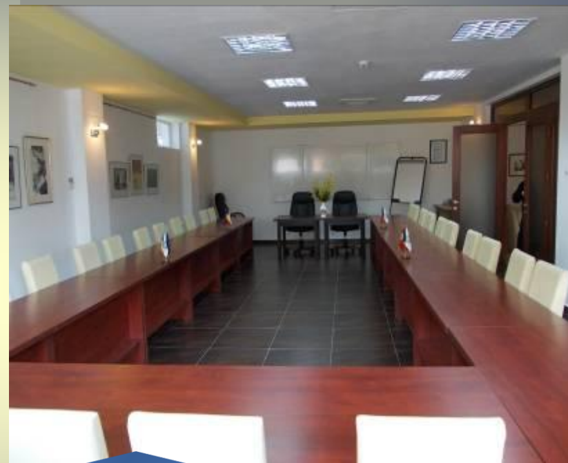
Sala "CARAIMAN" 40 de locuri

Sălile sunt dotate cu videoproiector, flipchart, tablă multifuncțională, PC, conexiune permanentă la Internet