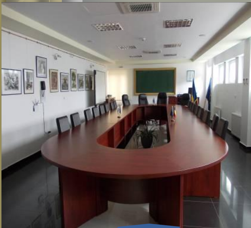
Sala "BAIULUI" 30 de locuri